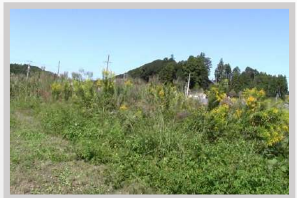
硬く、背の高い草の刈取りに