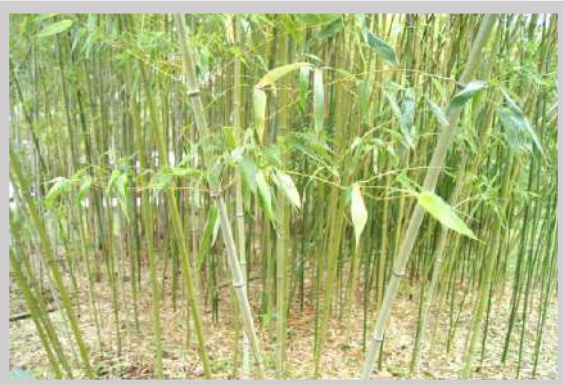
雑木・竹の刈取りに