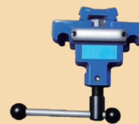
φ114.3, φ139.8 兼用 クランプ