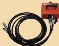
ブースター 超高圧ホース