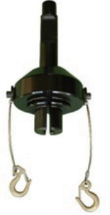
H鋼用 打込工具 (オプション) 質量 22.0kg