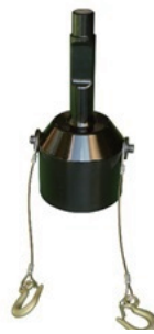
φ150 パイプ用 標準工具 (付属) 質量 23.5kg