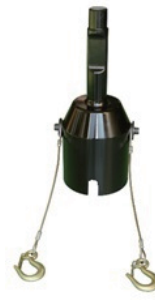
ガードレール用 打込工具 (オプション) 質量 24.0kg