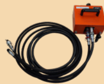
ブースター 超高压ホース