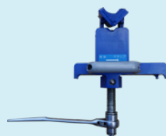
φ48.6 用 クランプ治具