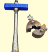
内抜き治具 (φ114.3, φ139.8, □125)