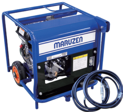
U-070-3 + 油圧ホース