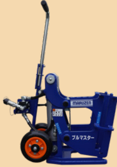
※EH-34B ※EH-34 と EH-34B は カブラが異なります。