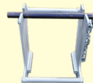
かさ上げ治具 (φ114.3, φ139.8)